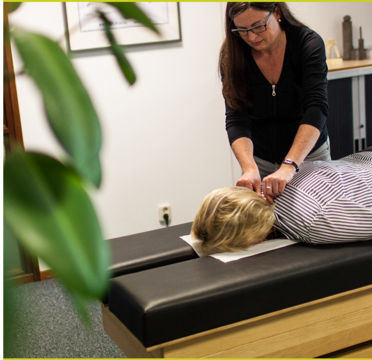
De bank wordt elektrisch bediend

De bank wordt elektrisch bediend. Door middel van een afstandsbediening kantelt de bank. De practitioner kan zijn aandacht volledig bij de cliënt houden. De banken zijn voorzien van een hydraulische pomp. Dit heeft als voordeel dat er geen veren nodig zijn en de bank spanningsloos is wanneer de motor uitstaat. De hydraulische motor is zeer geluidsarm.